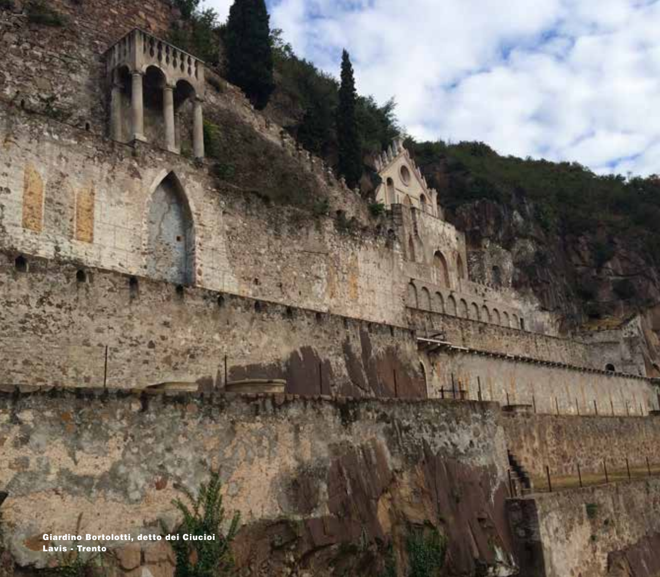
Giardino Bortolotti, detto dei Ciucioi Lavis - Trento