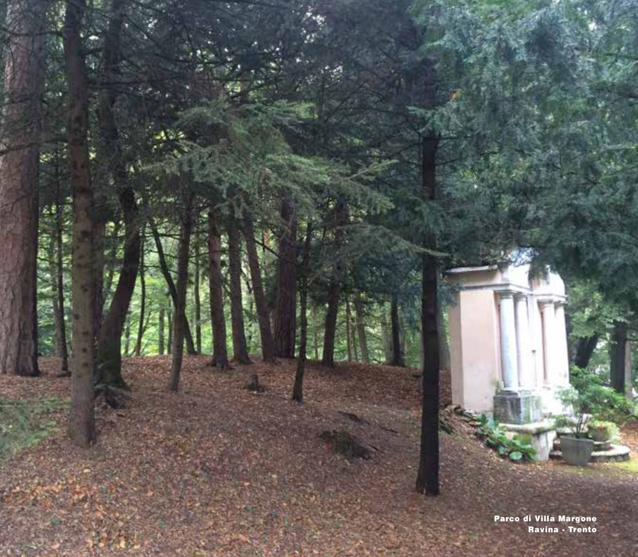
Parco di Villa Margone Ravina - Trento