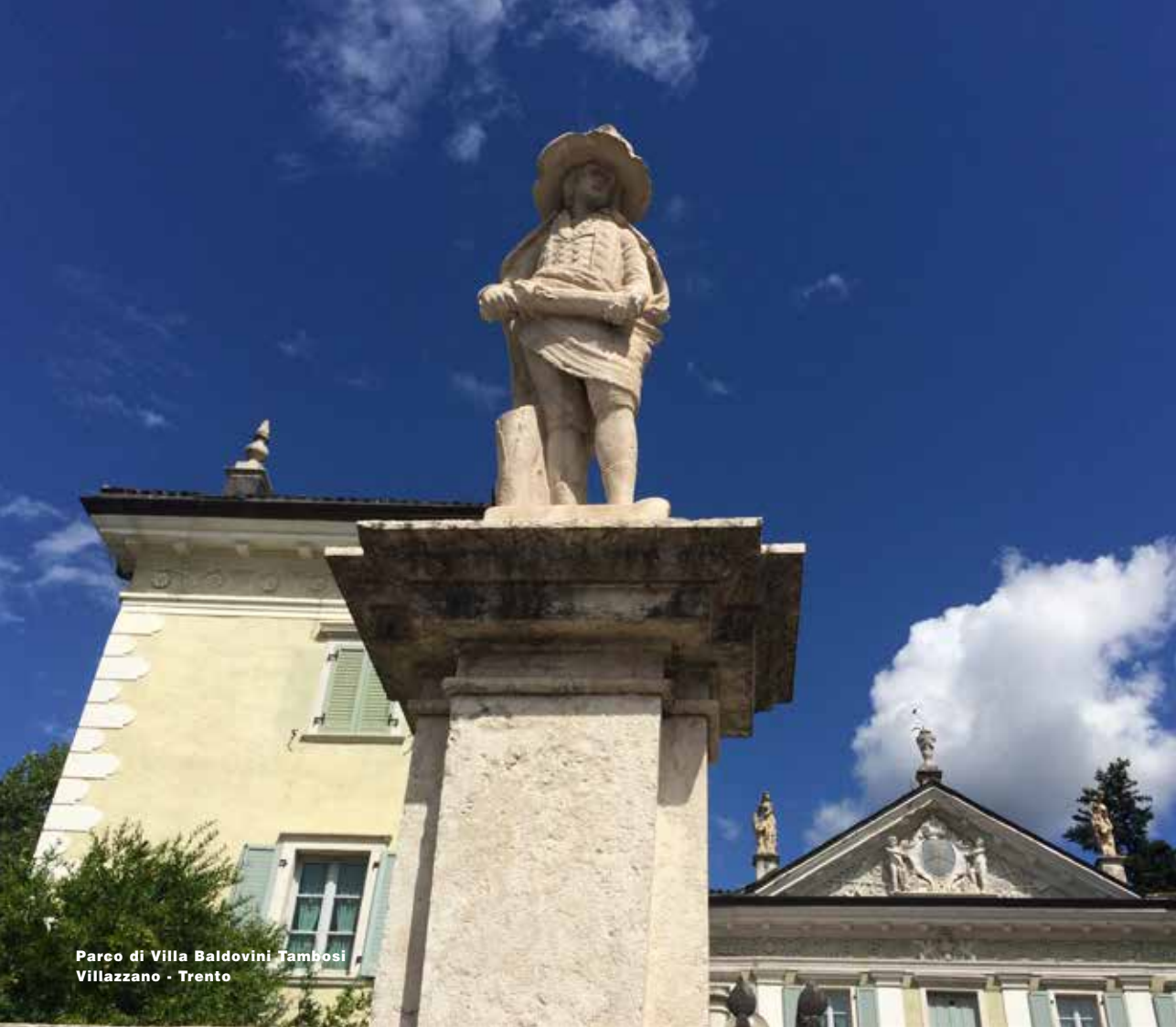
Parco di Villa Baldovini Tambosi Villazzano - Trento