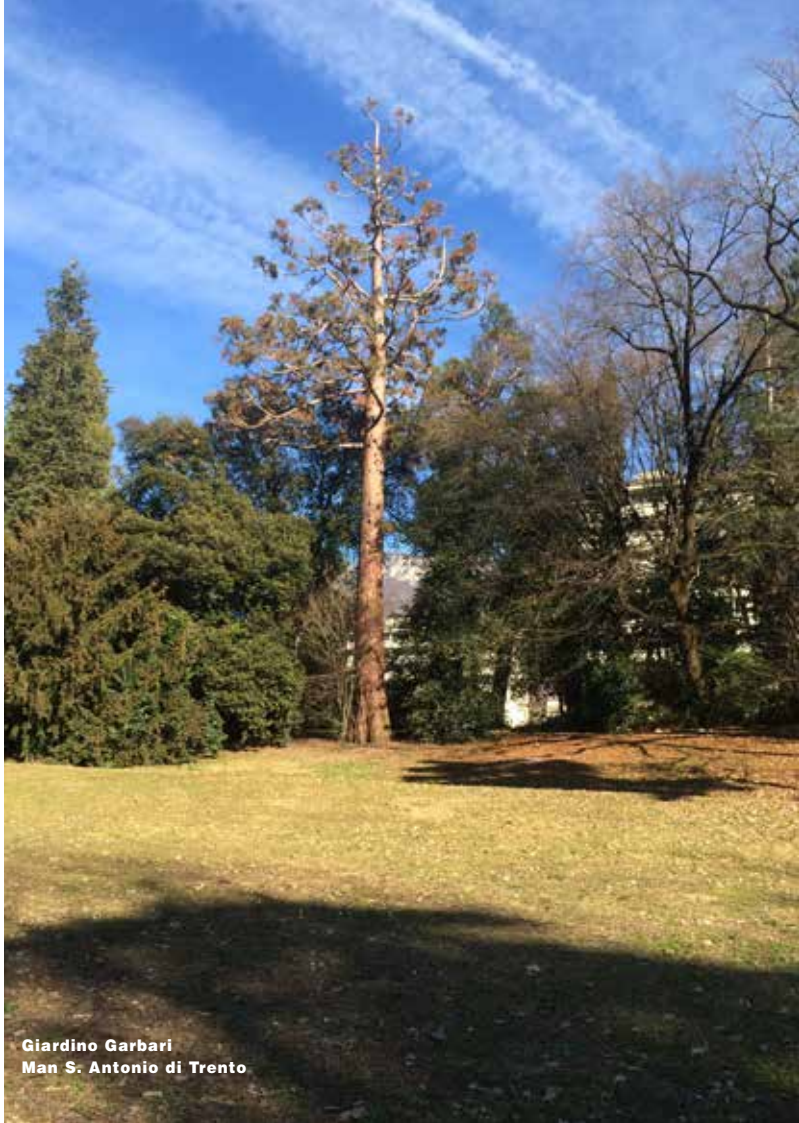
Giardino Garbari Man S. Antonio di Trento

Nessuna parte di questo libro può essere riprodotta o trasmessa in qualsiasi forma o con qualsiasi mezzo elettronico, meccanico o altro senza l'autorizzazione scritta degli autori o del proprietario dei diritti.