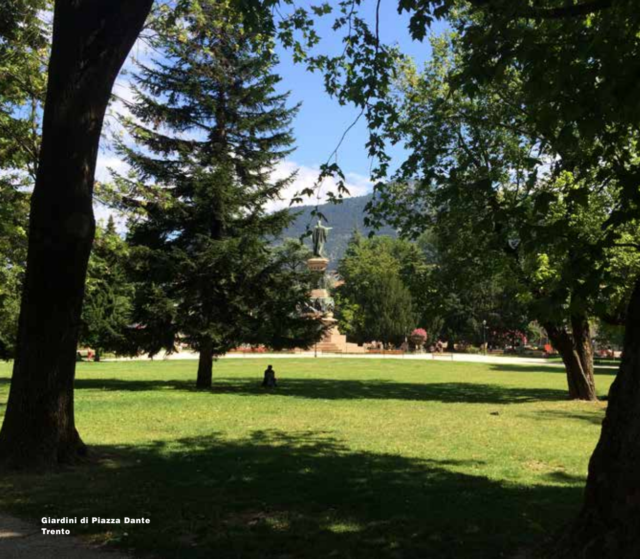
Giardini di Piazza Dante Trento