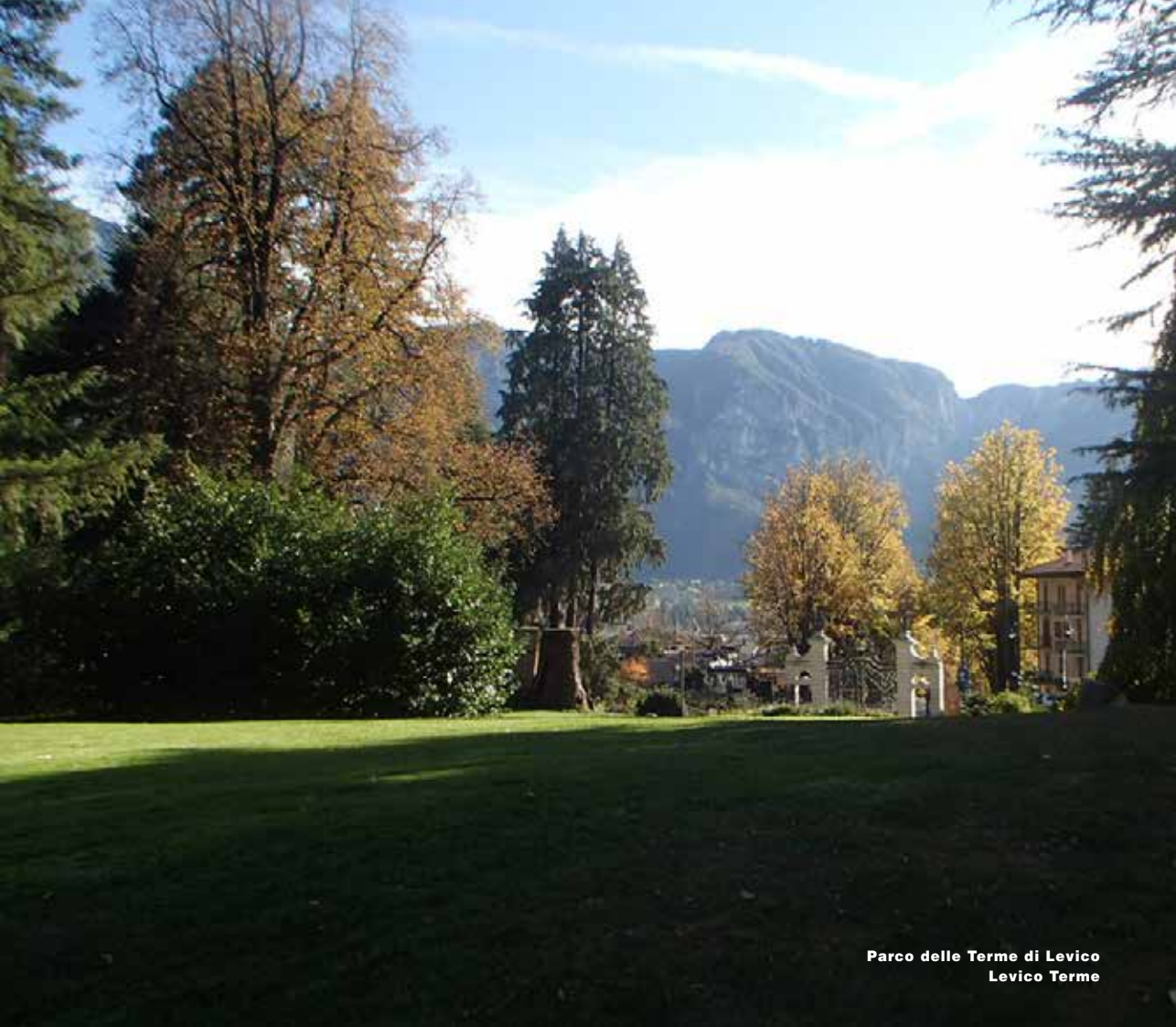
Parco delle Terme di Levico Levico Terme