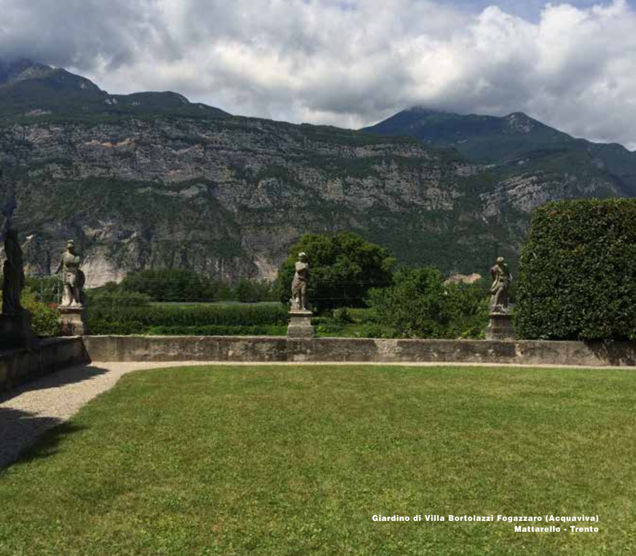
Giardino di Villa Bortolazzi Fogazzaro (Acquaviva) Mattarello - Trento