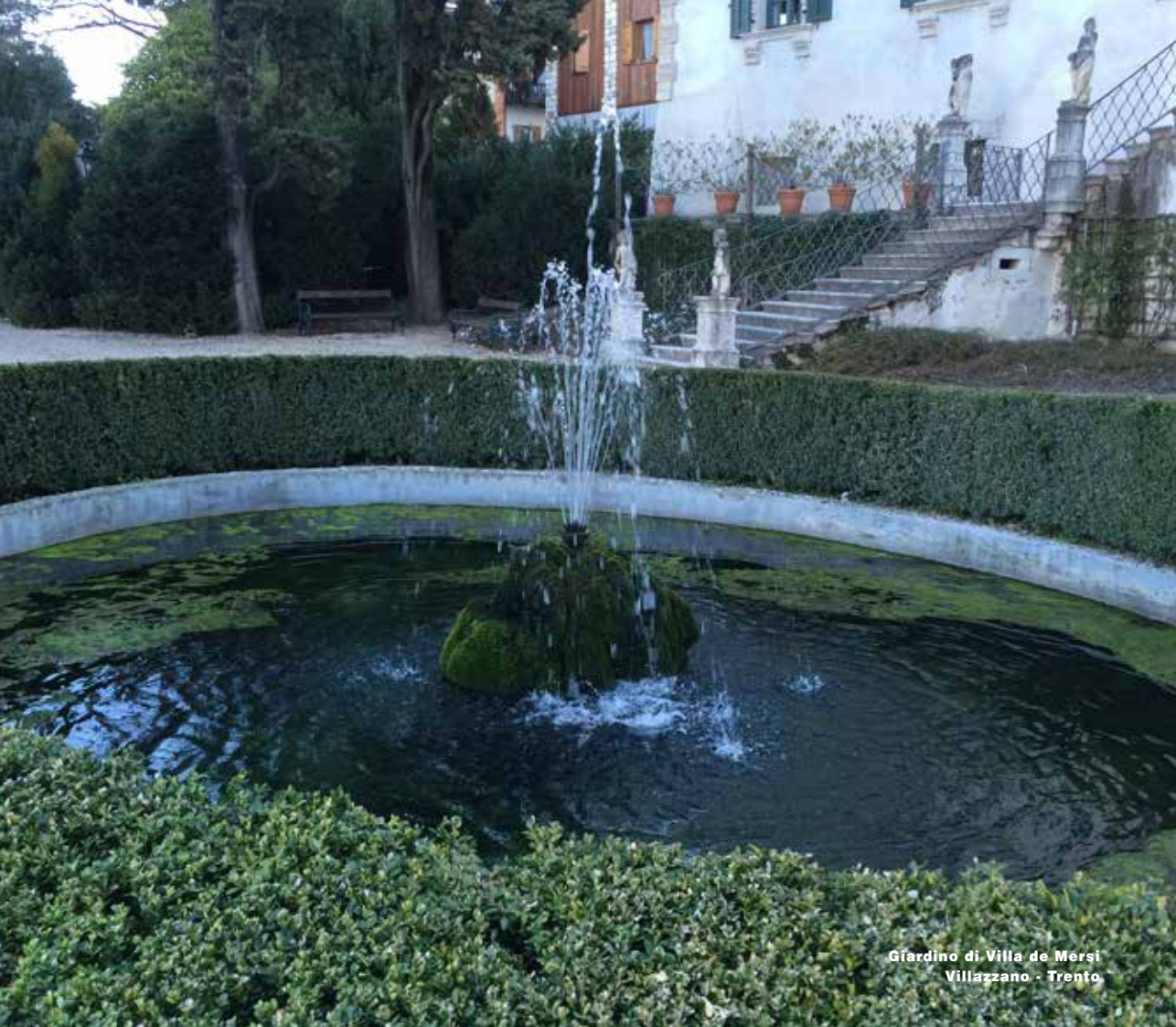
Giardino di Villa de Merisi Villazzano - Trento