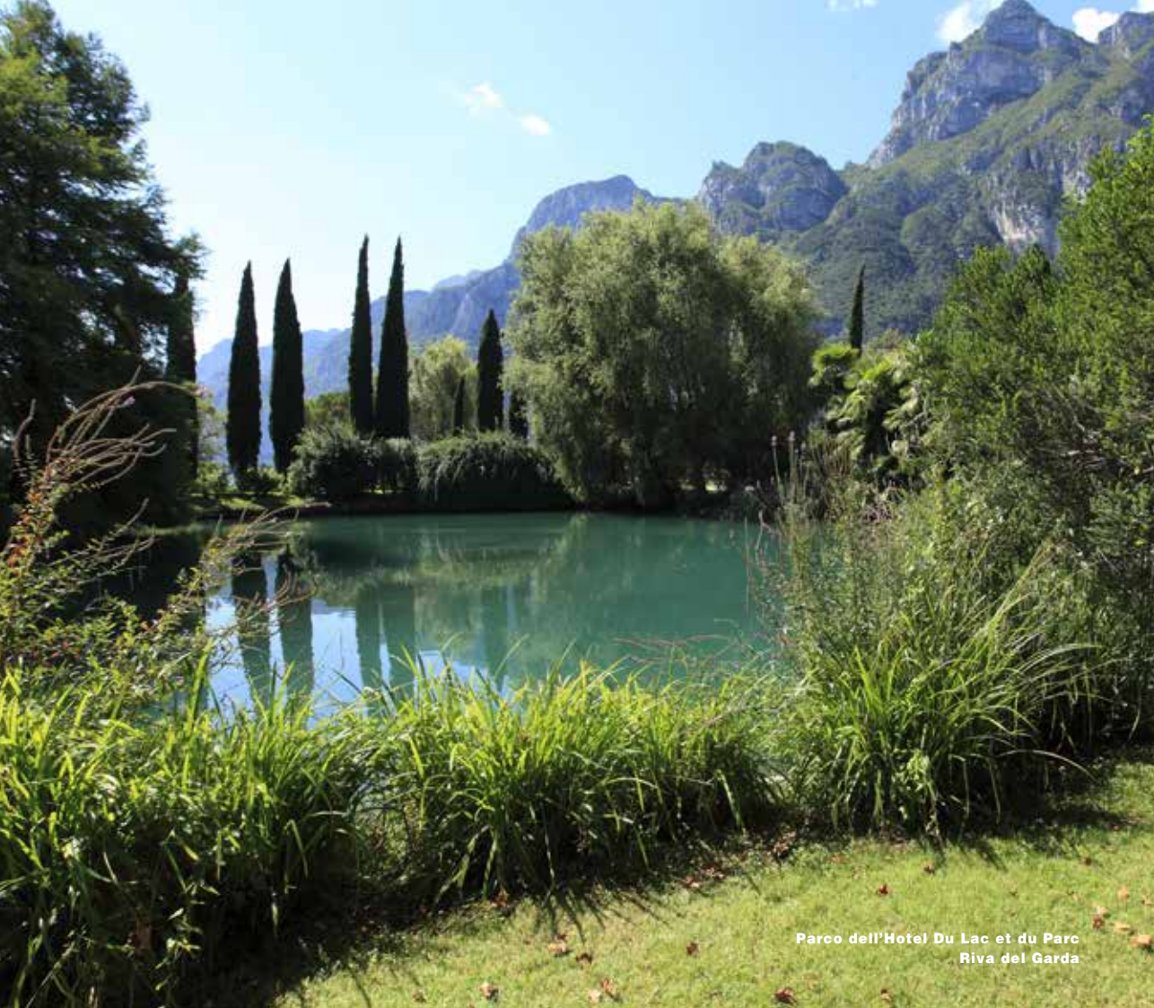
Parco dell'Hotel Du Lac et du Parc Riva del Garda