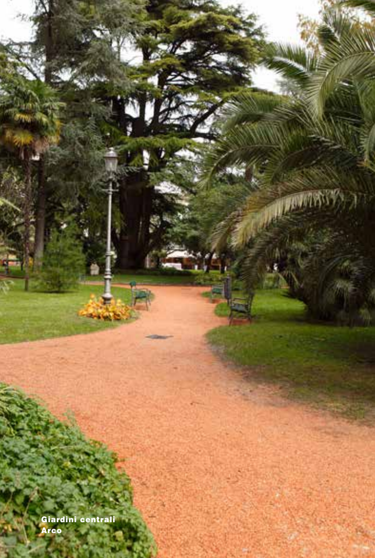
Giardini centrali Arco