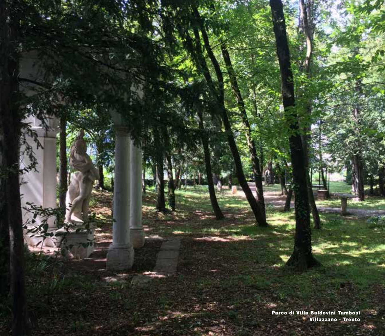
Parco di Villa Baldovini Tambosi Villazzano - Trento