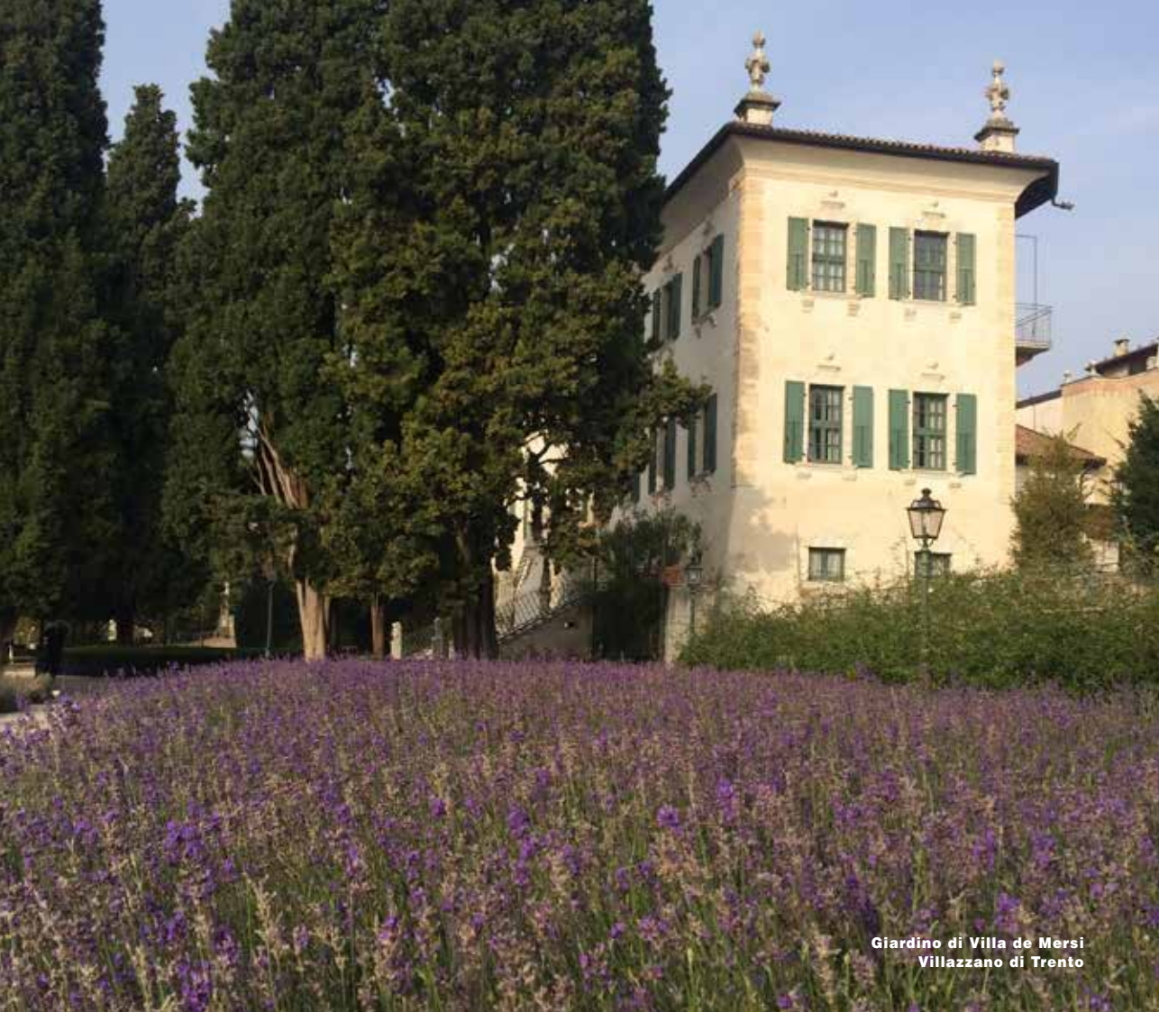
Giardino di Villa de Mersi Villazzano di Trento